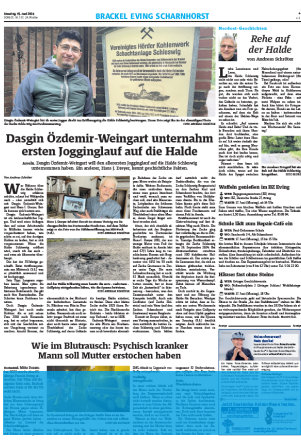
1/4 Seite 7sp./100 mm