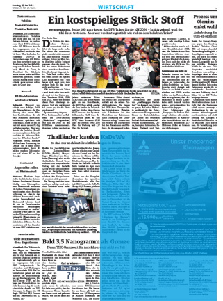
1000er Eckfeld 4sp./250 mm