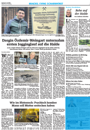
2/100 2sp./100 mm