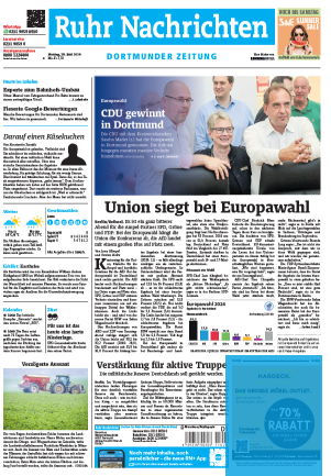
Titelfuß 2sp./100 mm