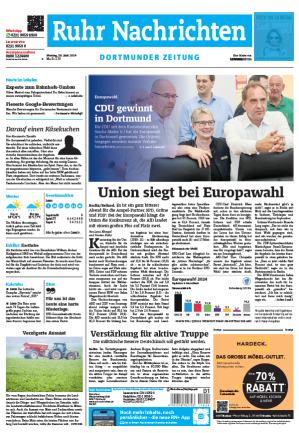
Titeltkopf 1sp./50 mm