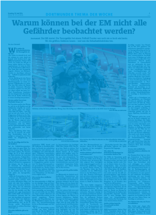
1/1 Seite 7sp./450 mm