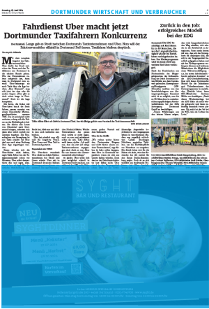
1/2 Seite 7sp./225 mm