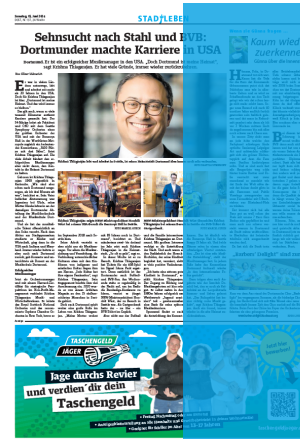
1/2 Seite hoch 3sp./450 mm