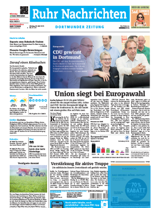
Titelfuß 2sp./100 mm