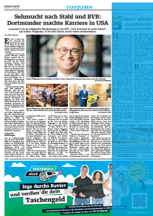
1/3 Seite hoch 2sp./450 mm