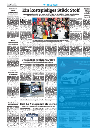
Eckfeld 1/4 Seite 3sp./250 mm