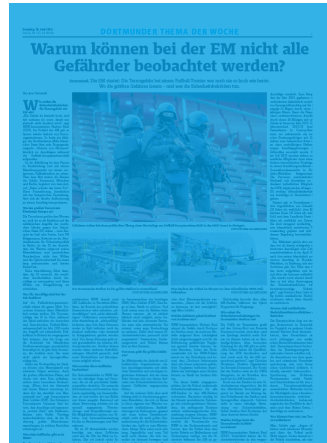
1/1 Seite 7sp./450 mm