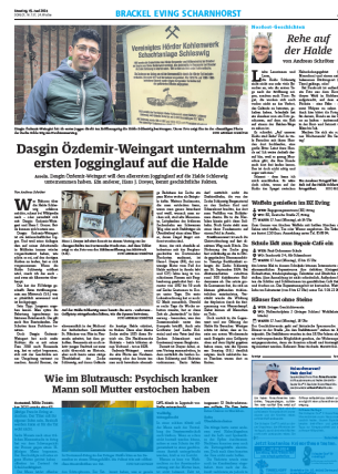
1/4 Seite quer 7sp./100 mm