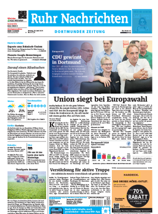
Titelkopf 1sp./50 mm