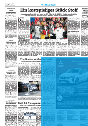
1000er Eckfeld 4sp./250 mm