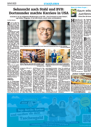
1/3 Seite quer 7sp./150 mm