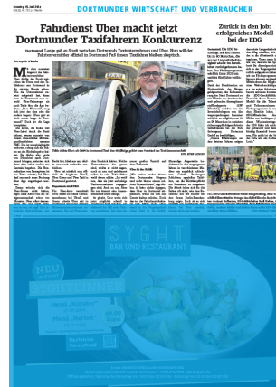
1/2 Seite quer 7sp./225 mm